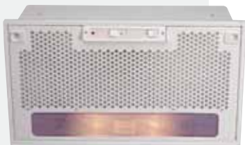
MOD. GF 2

Mandos mecánicos | Lámparas incandescentes | Tres velocidades | Válvula antirretorno | Piloto indicativo de funcionamiento | Doble filtro metálico | Integrable en muebles de cocina | Dos motores | Capacidades de extracción UNE-EN-61591: min. 274 m 3 /h - máx. 397 m 3 /h | Nivel sonoro UNE-EN-60704-2-13 dos motores: min. 34 dBA - máx. 50 dBA.