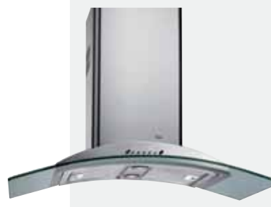
MOD. DF 90

Mandos electrónicos | Lámparas halógenas enrasadas | Tres velocidades + intensiva | Indicador digital de velocidad seleccionada | Programador del tiempo de aspiración | Sensor de humedad | Filtros metálicos decorativos | Panel interior de fácil limpieza | Indicador luminoso de saturación de filtros | Motor blindado de doble turbina | Capacidades de extracción UNE-EN-61591: min. 240 m 3 /h - máx. 780 m 3 /h | Nivel sonoro UNE-EN 60704-2-13: min. 28 dBA - máx. 57 dBA | Posibilidad de funcionamiento en recirculación (SET 1/C).