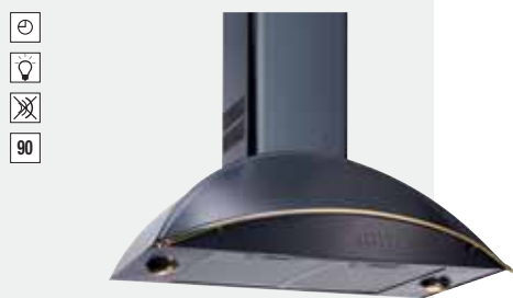
MOD. DR 90 Rústica

Color: Inox · Ref.: 40481000 · Precio: 690,00 € · RAEE: 3 €