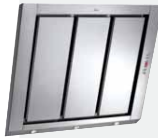
MOD. DV 80 Inox