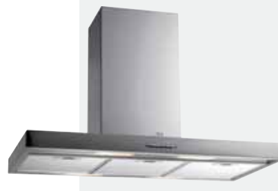
MOD. DH ISLA

Mandos pulsantes | Lámparas incandescentes | Tres velocidades + intensiva | Piloto indicativo de funcionamiento | Filtros metálicos | Panel interior de fácil limpieza | Motor blindado de doble turbina | Capacidades de extracción UNE-EN-61591: min. 240 m 3 /h - máx. 780 m 3 /h | Nivel sonoro UNE-EN 60704-2-13: min. 28 dBA - máx. 57 dBA | Posibilidad de funcionamiento en recirculación (SET 1/D).