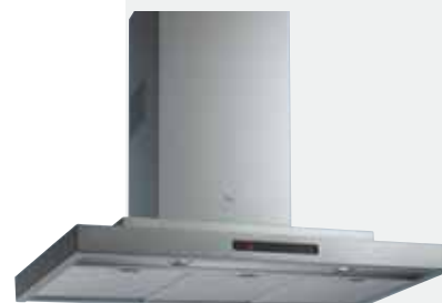
MOD. DT 90

Color: Cuerpo inox · Ref.: 40468110 · Precio: 555,00 € · RAEE: 3 € Color: Ala cristal 70 · Ref.: 40468113 · Precio: 168,00 € · RAEE: 0 € Color: Ala cristal 90 · Ref.: 40468114 · Precio: 198,00 € · RAEE: 0 €