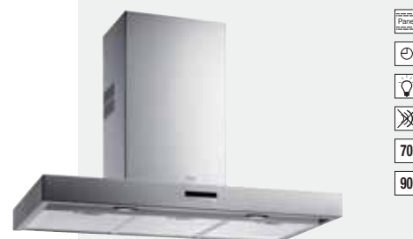
MOD. DHB 70/90

Color: Inox (DY 70) · Ref.: 40487001 · Precio: 518,00 € · RAEE: 3 € Color: Inox (DY 90) · Ref.: 40487002 · Precio: 547,00 € · RAEE: 3 € Color: Inox (DY 110) · Ref.: 40487003 · Precio: 648,00 € · RAEE: 3 €