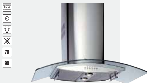
MOD. ND ALADA 70/90

Mandos electrónicos | Lámparas halógenas | Tres velocidades + intensiva | Indicador luminoso de velocidad seleccionada | Programador del tiempo de aspiración | Filtros metálicos decorativos | Panel interior de fácil limpieza | Motor blindado de doble turbina | Capacidades de extracción UNE-EN-61591: min. 240 m³/h - máx. 780 m³/h | Nivel sonoro UNE-EN 60704-2-13: min. 28 dBA - máx. 57 dBA | Posibilidad de funcionamiento en recirculación (SET 1/C).