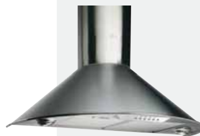
MOD. DC 60/70/90

Color: Negro · Ref.: 40470004 · Precio: 604,00 € · RAEE: 3 €