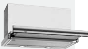
MOD. CNL 3000

Frente inox antihuella | Mandos pulsantes | Lámparas halógenas | Tres velocidades | Válvula antirretorno | Frente extraíble y sustituible | Filtros metálicos | Automática | Panel interior de seguridad | Dos motores de doble turbina | Capacidades de extracción UNE-EN-61591: min. 323 m 3 /h - máx. 448 m 3 /h | Nivel sonoro UNE-EN 60704-2-13: min. 36 dBA - máx. 42 dBA | Posibilidad de funcionamiento en recirculación (C3R).