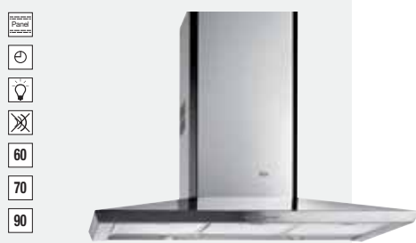
MOD. DS 60.1/70/90

Color: Inox (DC 60) · Ref.: 40471005 · Precio: 494,00 € · RAEE: 3 € Color: Inox (DC 70) · Ref.: 40471040 · Precio: 518,00 € · RAEE: 3 € Color: Inox (DC 90) · Ref.: 40471024 · Precio: 568,00 € · RAEE: 3 €