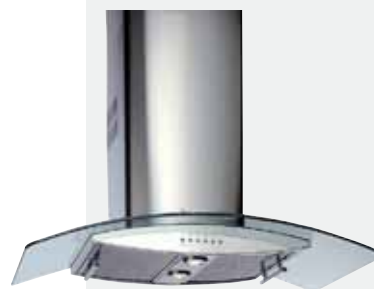
MOD. ND ALADA ISLA

Mandos por sensores electrónicos | Lámparas halógenas | Tres velocidades + intensiva | Indicador luminoso de velocidad seleccionada | Programador del tiempo de aspiración | Filtros metálicos decorativos | Panel interior de fácil limpieza | Motor blindado de doble turbina | Capacidades de extracción UNE-EN-61591: min. 240 m 3 /h - máx. 780 m 3 /h | Nivel sonoro UNE-EN 60704-2-13: min. 27 dBA - máx. 56 dBA | Posibilidad de funcionamiento en recirculación (SET 1/E).