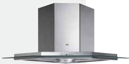
MOD. DG 90