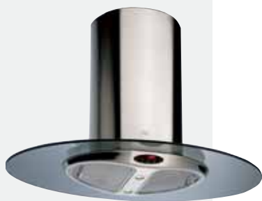
MOD. DX ISLA

Mandos digitales Touch Control | Lámparas halógenas enrasadas | Tres velocidades + intensiva | Indicador luminoso de velocidad seleccionada | Programador del tiempo de aspiración | Filtros metálicos decorativos | Panel interior de fácil limpieza | Motor blindado de doble turbina | Capacidades de extracción UNE-EN-61591: min. 240 m 3 /h - máx. 780 m 3 /h | Nivel sonoro UNE-EN 60704-2-13: min. 27 dBA - máx. 56 dBA | Posibilidad de funcionamiento en recirculación (SET 1/I).