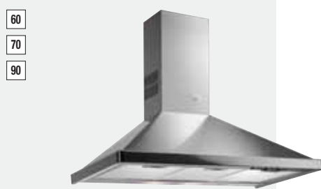
MOD. DE 60.2/70.2/90.2

Color: Inox (DM 60) · Ref.: 40476000 · Precio: 278,00 € · RAEE: 3 € Color: Blanco (DM 60) · Ref.: 40476001 · Precio: 254,00 € · RAEE: 3 € Color: Inox (DM 70) · Ref.: 40476002 · Precio: 307,00 € · RAEE: 3 € Color: Blanco (DM 70) · Ref.: 40476003 · Precio: 277,00 € · RAEE: 3 € Color: Inox (DM 90) · Ref.: 40476004 · Precio: 341,00 € · RAEE: 3 € Color: Blanco (DM 90) · Ref.: 40476005 · Precio: 318,00 € · RAEE: 3 €