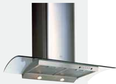
MOD. CL 90

Mandos electrónicos | Lámparas halógenas enrasadas | Tres velocidades + intensiva | Indicador digital de velocidad seleccionada | Programador del tiempo de aspiración | Filtros metálicos decorativos | Indicador luminoso de saturación de filtros | Panel interior de fácil limpieza | Motor blindado de doble turbina | Capacidades de extracción UNE-EN-61591: min. 240 m 3 /h - máx. 780 m 3 /h | Nivel sonoro UNE-EN 60704-2-13: min. 28 dBA - máx. 57 dBA | Posibilidad de funcionamiento en recirculación (SET 1/C).