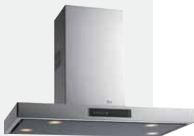
MOD. DP 90

Mandos digitales Touch Control | Mando a distancia de serie | Lámparas halógenas enrasadas | Tres velocidades + intensiva | Indicador digital de velocidad seleccionada | Programador del tiempo de aspiración | Filtros metálicos interiores | Indicador luminoso de saturación de filtros | Cristal decorativo abatible de fácil limpieza | Sistema de aspiración perimetral "Contour" | Motor blindado de doble turbina ultrasilencioso | Capacidades de extracción UNE-EN-61591: min. 210 m 3 /h - máx. 730 m 3 /h | Nivel sonoro UNE-EN 60704-2-13: min. 26 dBA - máx. 55 dBA | Posibilidad de funcionamiento en recirculación (SET 2/E).