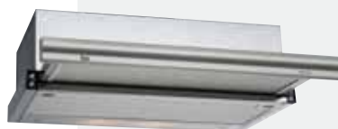
MOD. CNL 1001/2002

Frente Inox antihuella | Mandos pulsantes | Lámparas incandescentes | Tres velocidades | Válvula antirretorno | Frente extraíble y sustituible | Automática | Capacidades de extracción UNE-EN-61591 (un motor): min. 144 m 3 /h - máx. 272 m 3 /h | Capacidades de extracción UNE-EN-61591 (dos motores): min. 220 m 3 /h - máx. 400 m 3 /h | Nivel sonoro UNE-EN-60704-2-13 (un motor): min. 30 dBA - máx. 49 dBA | Nivel sonoro UNE-EN-60704-2-13 (dos motores): min. 34 dBA - máx. 50 dBA | Posibilidad de funcionamiento en recirculación (C1C).