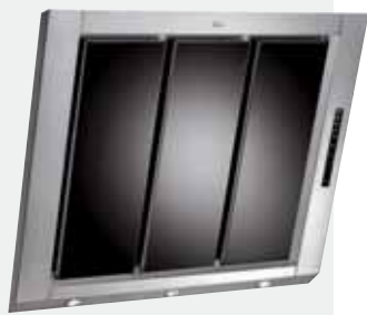
MOD. DV 80 Cristal