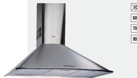
MOD. DM 60/70/90

Color: Inox (DH 60) · Ref.: 40484000 · Precio: 295,00 € · RAEE: 3 € Color: Inox (DH 70) · Ref.: 40484001 · Precio: 325,00 € · RAEE: 3 € Color: Inox (DH 90) · Ref.: 40484002 · Precio: 370,00 € · RAEE: 3 €