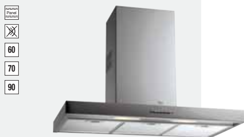
MOD. DH 60/70/90

Color: Inox (DHB 70) · Ref.: 40487101 · Precio: 414,00 € · RAEE: 3 € Color: Inox (DHB 90) · Ref.: 40487102 · Precio: 432,00 € · RAEE: 3 €