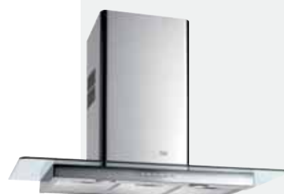
MOD. DG2 70/90

Mandos electrónicos retroiluminados | Lámparas halógenas | Tres velocidades + intensiva | Indicador luminoso de velocidad seleccionada | Programador del tiempo de aspiración | Filtros metálicos | Motor blindado de doble turbina | Capacidades de extracción UNE-EN-61591: min. 240 m³/h - máx. 780 m³/h | Nivel sonoro UNE-EN 60704-2-13: min. 28 dBA - máx. 56 dBA | Posibilidad de funcionamiento en recirculación (SET 1/C).