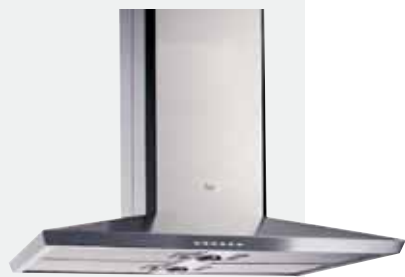
MOD. DS ISLA

Mandos electrónicos retroiluminados | Lámparas halógenas | Tres velocidades + intensiva | Indicador luminoso de velocidad seleccionada | Programador del tiempo de aspiración | Filtros metálicos | Panel interior de fácil limpieza | Motor blindado de doble turbina | Capacidades de extracción UNE-EN-61591: min. 240 m 3 /h - máx. 780 m 3 /h | Nivel sonoro UNE-EN 60704-2-13: min. 27 dBA - máx. 56 dBA | Posibilidad de funcionamiento en recirculación (SET 1/D).