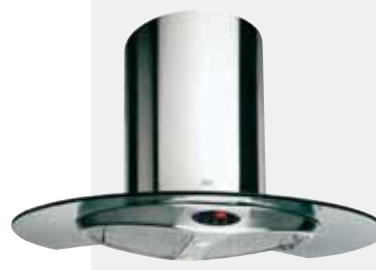
MOD. DX 90

Mandos digitales Touch Control | Lámparas halógenas enrasadas | Tres velocidades + intensiva | Indicador luminoso de velocidad seleccionada | Programador del tiempo de aspiración | Filtros metálicos decorativos | Panel interior de fácil limpieza | Motor blindado de doble turbina | Capacidades de extracción UNE-EN-61591: min. 240 m 3 /h - máx. 780 m 3 /h | Nivel sonoro UNE-EN 60704-2-13: min. 28 dBA - máx. 57 dBA | Posibilidad de funcionamiento en recirculación (SET 1/H).