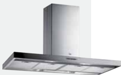
MOD. DH 120 ISLA

Mandos pulsantes | Lámparas incandescentes | Tres velocidades + intensiva | Piloto indicativo de funcionamiento | Filtros metálicos | Panel interior de fácil limpieza | Motor blindado de doble turbina | Capacidades de extracción UNE-EN-61591: min. 240 m 3 /h - máx. 780 m 3 /h | Nivel sonoro UNE-EN 60704-2-13: min. 28 dBA - máx. 57 dBA | Posibilidad de funcionamiento en recirculación (SET 1/D).