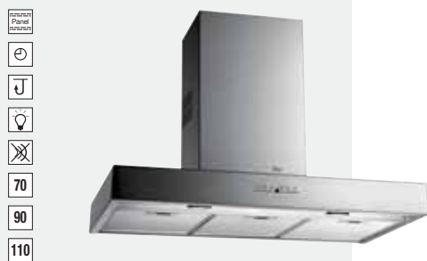
MOD. DY 70/90/110

Mandos por sensores electrónicos | Lámparas halógenas enrasadas | Tres velocidades + intensiva | Indicador digital de velocidad seleccionada | Programador del tiempo de aspiración | Filtros metálicos | Indicador luminoso de saturación de filtros | Panel interior de fácil limpieza | Motor blindado de doble turbina | Capacidades de extracción UNE-EN-61591: min. 240 m³/h - máx. 780 m³/h | Nivel sonoro UNE-EN 60704-2-13: min. 28 dBA - máx. 57 dBA | Posibilidad de funcionamiento en recirculación (SET 1/C).