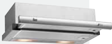
MOD. TL1 62

Mandos mecánicos | Lámparas incandescentes | Dos velocidades | Válvula antirretorno | Filtros metálicos un tirador | Frente extraíble y sustituible | Automática | Motor de doble turbina | Capacidades de extracción UNE-EN-61591: min. 249 m³/h - máx. 303 m³/h | Nivel sonoro UNE-EN 60704-2-13: min. 38 dBA - máx. 46 dBA | Posibilidad de funcionamiento en recirculación (C3C).